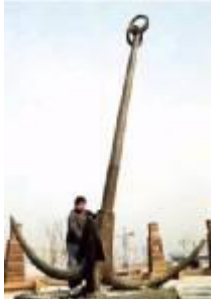
สมอเรือที่หลงเหลือจากการ เดินทางของเจิ้งเหอ

เลียบเมืองชายฝั่งตะวันออกของทวีปแอฟริกา ได้แก่ มากาดีชู บราวา มาลินดี(เคนยา) หมู่เกาะลามู หมู่เกาะมาดากัสการ์ เป็นต้น ปริศนาการตายของเจิ้งเหอ