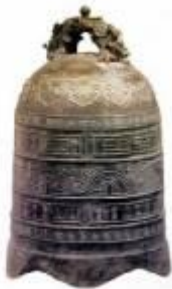
ระฆังที่เจิ้งเหอสร้างก่อนการเดินทาง ครั้งสุดท้ายเพื่อบูชาต่อฟ้าดินให้ เดินทางโดยสวัสดิภาพ ปัจจุบันจัด แสดงอยู่ที่หอนิทรรศการ สวน สาธารณะเจิ้งเหอ เมืองหนันจิง