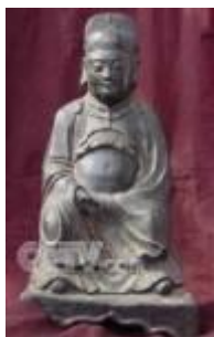
รูปหล่อสำริด "เจิ้งเหอ" ที่ขุดพบในอินเดีย

เจิ้งเหอออกเดินทางท่องสมุทรรวม 7 ครั้ง ระหว่างปี (1405-1433) โดยอาจแบ่งช่วงการเดินทางของเจิ้งเหอออกเป็นสองส่วน โดยให้การเดินทางสามครั้งแรกของเจิ้งเหอ เป็นระยะแรก และสี่ครั้งหลังเป็นระยะหลัง