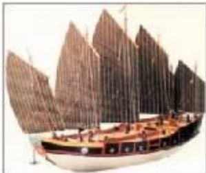
เรือเสบียง