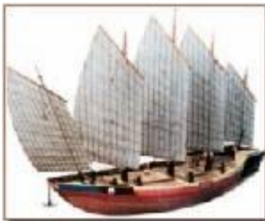
เรือกำลังพล