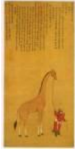
ภาพการฉาย "กิลิน" หรือชิราฟที่ได้รับ การจดบันทึกในประวัติศาสตร์จีน