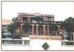
ตึกแดง ที่พักทนายท่หลังของเจ้าชาย จากลังกาที่เมืองเฉียนโจว ประเทศจีน ปัจจุบันใช้แซ่ ชื่อ (世)