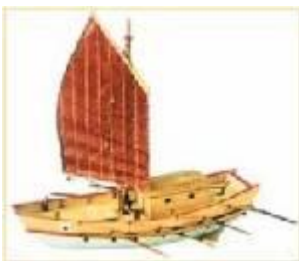
เรือบรรทุกน้ำ