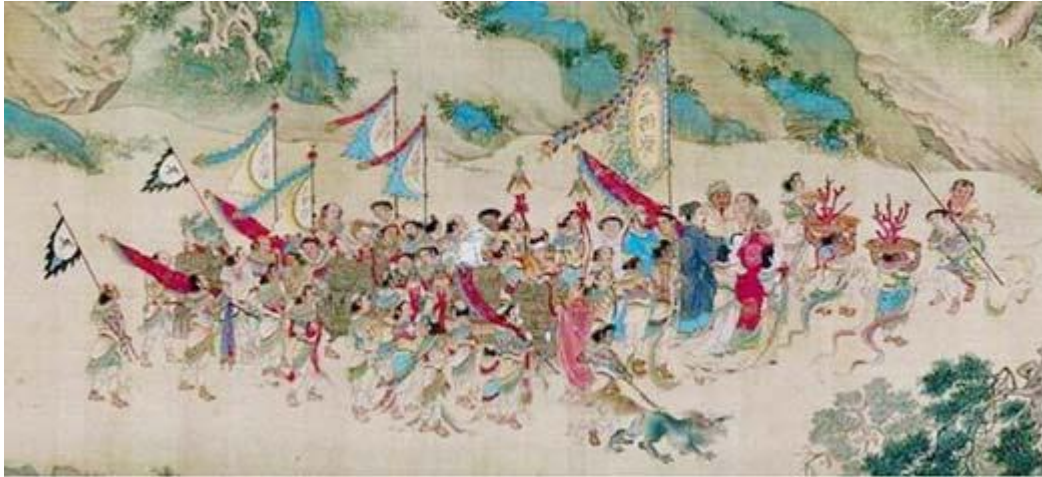
เจิ้งเหอปราบโจรสลัดบริเวณช่องแคบมะละกา