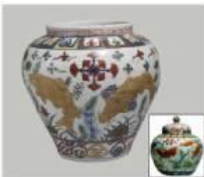
ส่วนหนึ่งของเครื่องถ้วยที่เคยเป็น สินค้าส่งออกของจีน

สำคัญอีกด้วย (จากหนังสือ เจิ้งเหอ แม่ทัพขันทิ "ซาปอคง" โดย ปรีวิวัฒน์ จันทร)