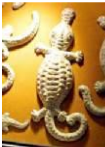
เงินลึงการูปสัตว์ ที่พ่อค้าจีนใช้ แลกเปลี่ยนสินค้าในสมัยนั้น