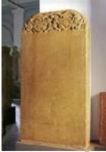
แผ่นศิลาจารึกสามภาษาที่เจิ้งเหอได้นำ ขึ้นมาไว้บนฝั่งของลังกา ปัจจุบันจัด แสดงอยู่ที่พิพิธภัณฑสถานแห่งชาติ กรุงโคลัมโบ ศรีลังกา