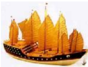
เรือมหาสมบัติ

“ในยุคสมัยที่ยังไม่มีเทคโนโลยีโทรคมนาคมและเครื่องมือเครื่องใช้เหมือนในปัจจุบัน บนท้องทะเลอันกว้างใหญ่ ด้วยจำนวนคนและกองเรือขนาดมหึมาพวกเขาสามารถฟันฝ่าคลื่นลมพายุกลับมาโดยปลอดภัยทุกครั้งได้อย่างไร? คำตอบอยู่ที่ภูมิปัญญาในการจัดระเบียบการติดต่อสื่อสารระหว่างเรือแต่ละลำ”