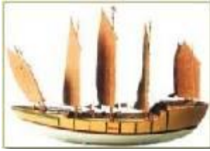
เรือบรรทุกม้า