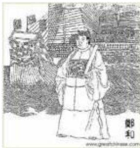
เจิ้งเหอกับเรือมหาสมบัติ