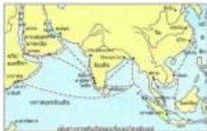
แผนที่เส้นทางการเดินเรือของเจิ้งเหอ