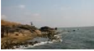
คาลิกัตเมืองท่าโบราณของอินเดีย