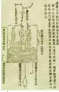
แผนที่ดาราศาสตร์ประกอบ เส้นทางเดินเรือของเจิ้งเหอ