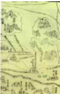
ภาพแผนที่การเดินทางเรือของเจิ้งเหอ

สะดวกทั่วไป รวมถึงหน่วยแพทย์ที่คอยดูแลสุขภาพให้กับลูกเรือ เป็นต้น ส่วนกองกำลังป้องกัน ทำหน้าที่ดูแลรักษาความปลอดภัยทั่วไปของขบวนเรือ